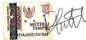
Devin Yasdo Wardana Purba NIM.19154001