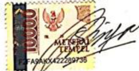
Sabila Chaerani NIM: 20320136