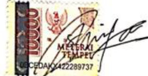
Sabila Chaerani NIM: 20320124