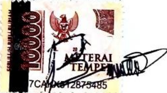
Bastio Anggoro NIM. 20310024