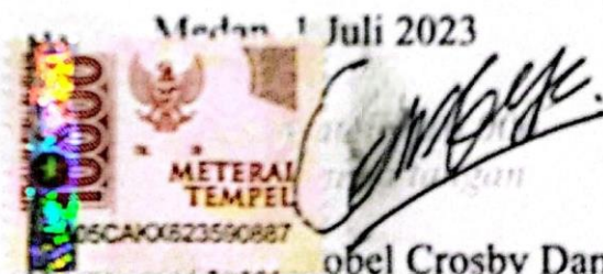
Nobel Crosby Damanik NIM: 20521054

Demikian pernyataan ini saya buat dengan sebenarnya