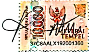
Ratu Taqiyyah 21100131