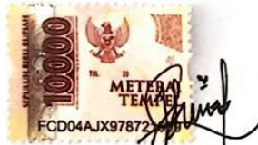
Siti Nur Halizah NIM: 19030123