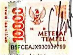
Chika Aulia 19031023