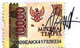
Rizal Ayubi NIM: 20310110