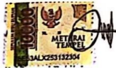
Priskawati Pakila' NIM: 21632001