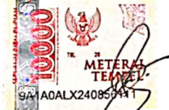
Putri Sa'adah NIM: 21310074