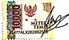
Iqbal Prasetyo Tamin NIM: 21310040