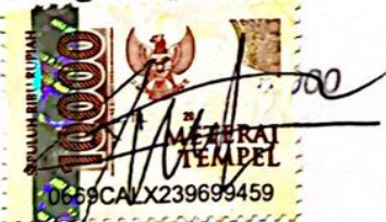
Nabila Priamanda NIM: 21100109