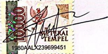
Nabila Priamanda NIM: 21100109